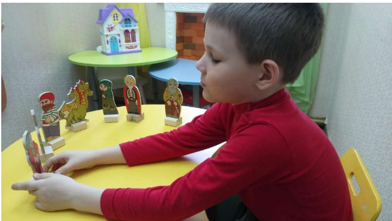
Настольный театр игрушек: Фабричный и самодельный